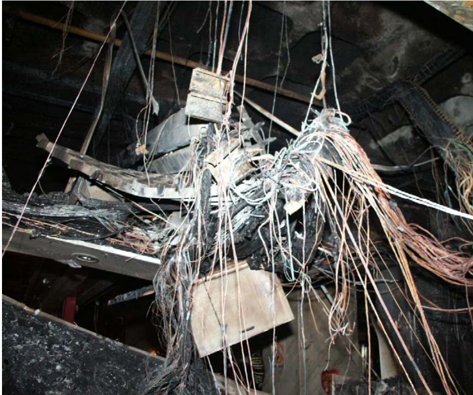
ערימה של כבלים שרופים מעל הגג של ביתן הקופה שקרט