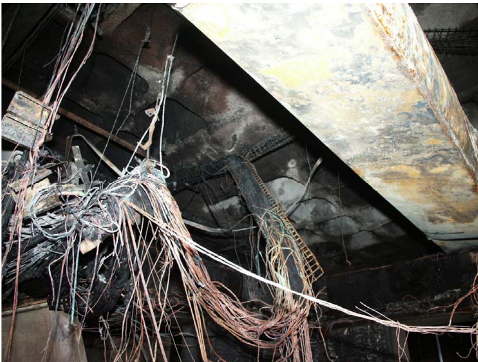
תמונה של החלק העליון של ביתן הקופה עד לתקרה.